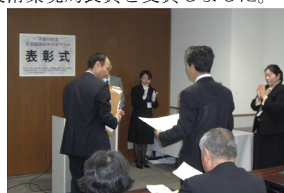
表彰式 平成 19 年 10 月 27 日