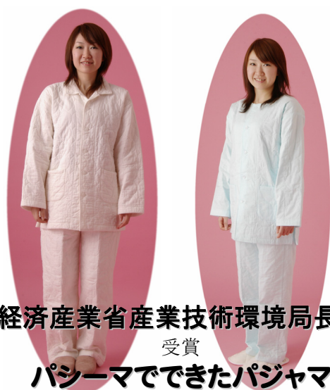
経済産業省産業技術環境局長賞 受賞 パシーマでできたパジャマ

「平成 19 年度全国繊維技術交流プラザ」(主催:全国繊維技術協会、財団法人日本産業技術振興協会、福岡県)において、福岡県の龍宮株式会社の「パシーマでできたパジャマ」が、その技術性、実用性、独創性が評価され、経済産業省産業技術環境局長賞を受賞しました。